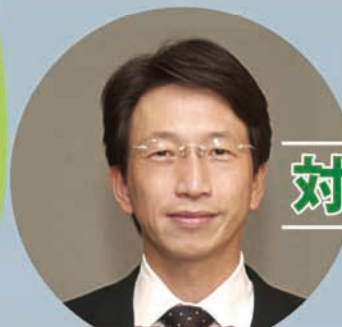
平 将明 氏 衆議院議員、内閣府副大臣

地方創生元年、そして東京五輪・パラリンピックまであと5年を迎え、関東各地は今後ますます盛り上がりを見せてきます。この盛り上がり地域活性化へとつなげるには、地域の魅力を高め広く発信し、交流人口の増加を図ることが必要です。では、地域の魅力は何か。地域の何・どこに人は魅力を感じるのか。本フォーラムでお伝えいたします。